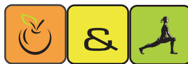
Programme cantonal de promotion de la santé alimentation & activité physique

319 c'est le nombre de participants à Midi actif pour les 25 cours donnés.